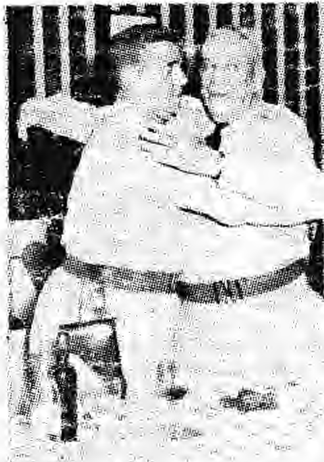
COWLEY, EL REPUGNANTE CHACAL DE HOLGUÍN ES FELICITADO POR SU JEFE TABERNILLA